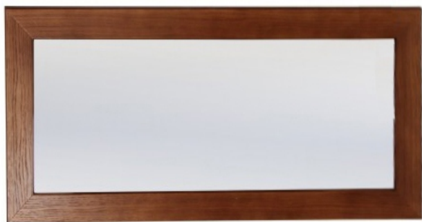
Зеркало в рамке

ГОСТ 16371-2014 "Мебель. Общие технические условия" ГАРАНТИЙНЫЙ СРОК - 24 месяца со дня приобретения. СРОК СЛУЖБЫ при правильной эксплуатации - не менее 5 лет Почта для отзывов: bez-braka@mail.ru